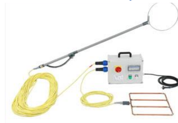
SE 300 anvendes til vade fiskeri i mindre